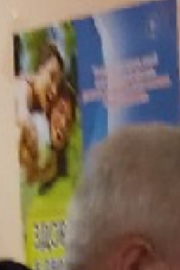
График работы рецептурного кабинета Общественный прием 11:00 - 13:00

ВНИМАНИЕ!! В поликлинику необходимо приходить только в чистой одежде и обуви, а также используя маску.